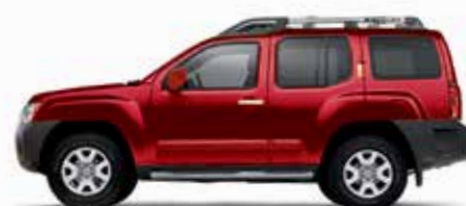
أحمر فاقع (NAH) Cayenne Red (NAH)