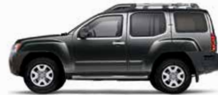
رمادي ليلي (K26) Night Armor (K26)