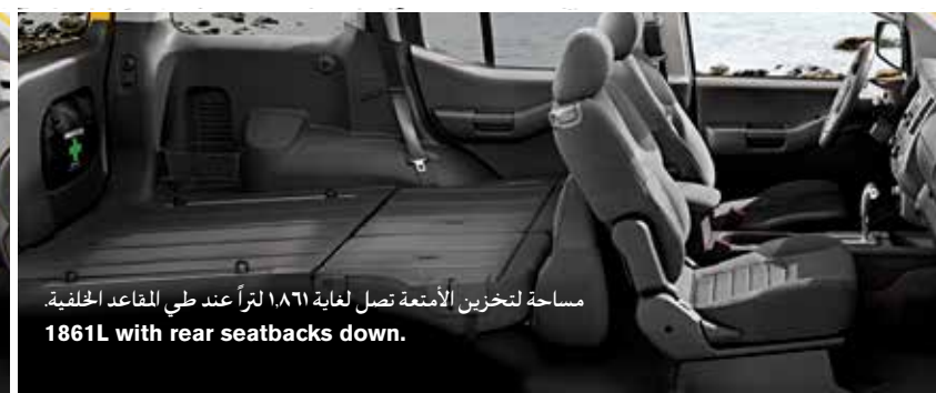
مساحة لتخزين الأمتعة تصل لغاية ١,٨٦١ لتراً عند طي المقاعد الخلفية. 1861L with rear seatbacks down.