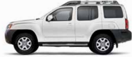
أبيض ثلجي (QAK) Glacier White (QAK)