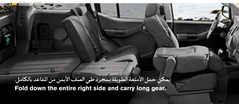
يمكن حمل الأمتعة الطويلة بمجرد طي الصف الأيمن من المقاعد بالكامل. Fold down the entire right side and carry long gear.

مهما كانت الأمتعة التي ترغب في حملها لرحلتك الترفيهية التالية، ثق أن إكس تيرا ستكون جاهزة لاستيعابها. فالمقاعد الخلفية القابلة للطي والتي تنقسم مساندتها الخلفية بنسبة ٤٠/٦٠ ومقعد الراكب الأمامي القابل للطي الذي ينسبط تماماً، يمنحانك خيارات كثيرة. استعد لاصطحاب كل ما يلزمك، ولا داعٍ للتخلي عن رفيقك بعد الآن بسبب لوح لركوب الأمواج.