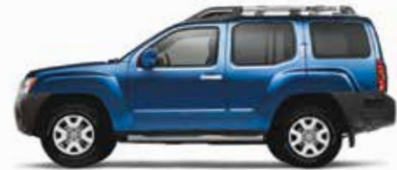
أزرق معدني (B17) Metallic Blue (B17)