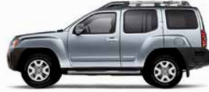
فضي لمّاح (K23) Brilliant Silver (K23)