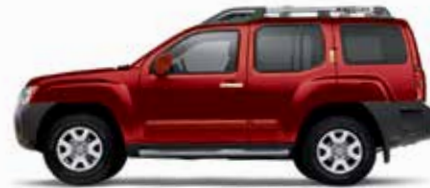
أحمر فاني (EAF) Lava Red (EAF)