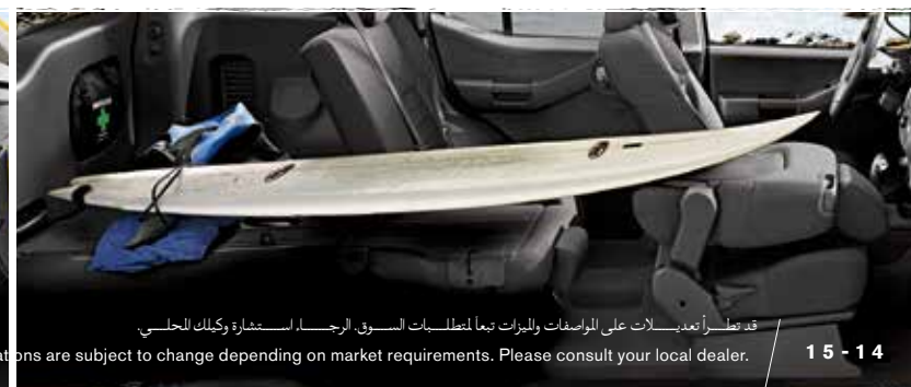
قد تظهر تعديلات على المواصفات والميزات تبعاً لمتطلبات السوق. الرجاء استشارة وكيلك المحلي.