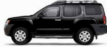
أسود (KH3) Super Black (KH3)